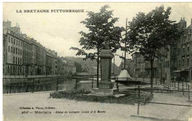
Collection A. Wares, Bédéro 1912 — Morlaix - Statue du Corsaire Cornic et le Bassin