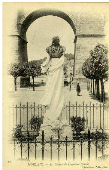
Le premier monument, 1897, place Thiers (des Otages) - carte postale