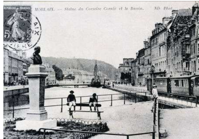
Le deuxième monument, 1912, place Cornic - cartes postales