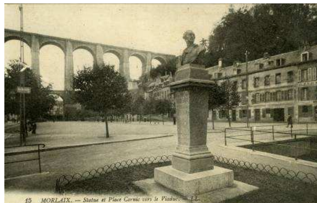
15 MORLAIX. — Statue et Place Cornic vers le Viaduc. — LL