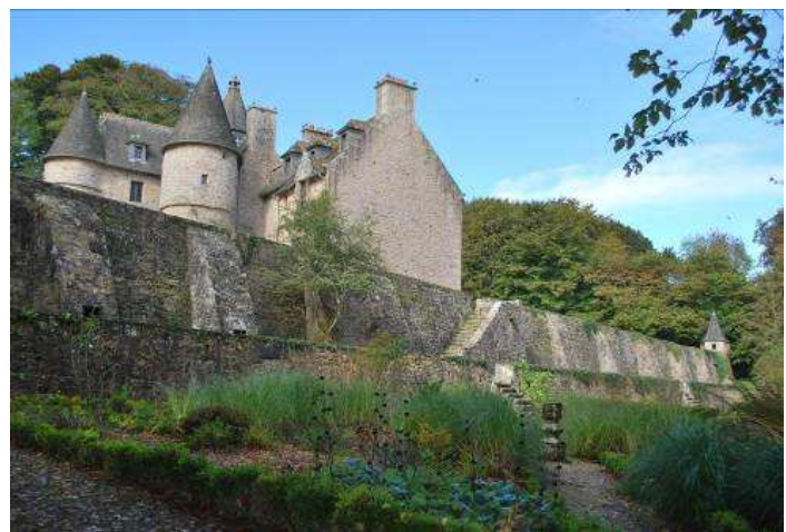
Le Manoir de Suscinio en Ploujean

Il revient s'installer en Bretagne en 1793 et achète le manoir de Suscinio en 1794. Il effectue alors quelques missions d'inspections, mandaté par le Comité de Salut Public, puis sera nommé capitaine du port de Morlaix en 1795. Il sera évincé de cette place en 1800. Blessé et amer, Cornic se retire de la vie publique avant de s'éteindre quai de la République le 12 septembre 1809. Très attaché à la région morlaisienne, il n'aura de cesse de se soucier de la sécurité des approches du port, finançant même une partie du balisage et l'établissement d'une carte de la rade à ses propres frais.