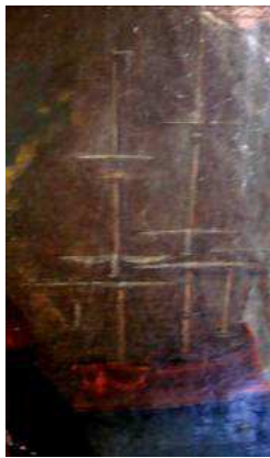
La Félicité, représentée en fond du portrait peint

En 1760, il prend le commandement de deux navires de la marine royale qu'une société d'actionnaires arme à ses frais et devient alors le commandant d'un vaisseau de 64 canons, « Le Protée » : Charles Cornic est devenu officiellement corsaire. Il réalise en mars 1761 sa plus belle prise, « l'Ajax » dont la cargaison est évaluée à la somme colossale de trois millions de livres !