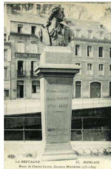
Le deuxième monument, 1912, place Cornic - carte postale, coll. part